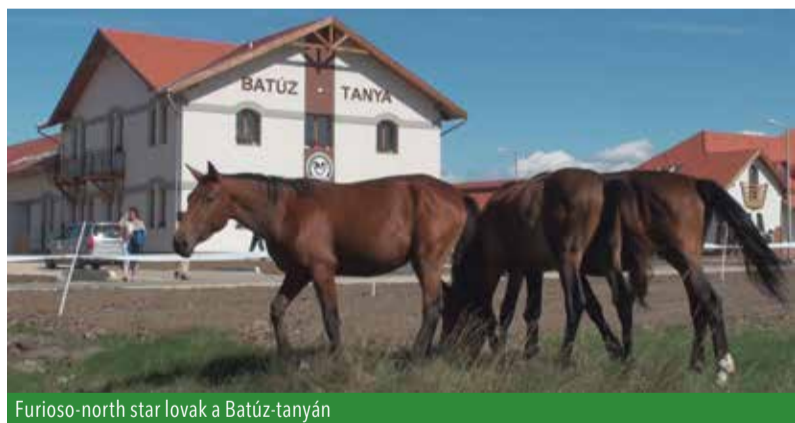
Furioso-north star lovak a Batúz-tanyán

Kollégáink áldozatos és kitartó munkájának köszönhetően 8 ménünk tett sikeres ménevizsgát, jelentősen hozzájárulva ezzel a hazai furioso-north star állomány tenyésztéséhez. Az elmúlt egy év újabb színfoltot jelentett a ménes életében: lovaink képességét nemcsak nyereg alatt, de fogatban és díjjugratásban is volt lehetőségünk kipróbálni. Több versenyen és szakmai kiállításon is részt vettünk és szép sikereket értünk el.