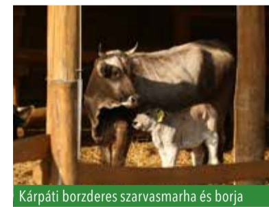
Kárpáti borzderes szarvasmarha és borja