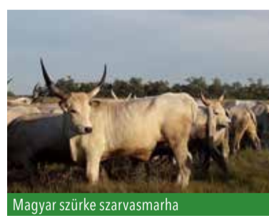
Magyar szürke szarvasmarha